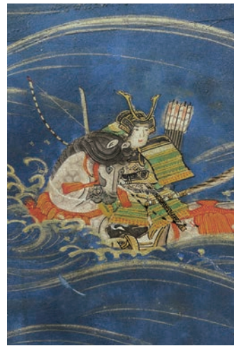
平 敦盛(部分) ▲